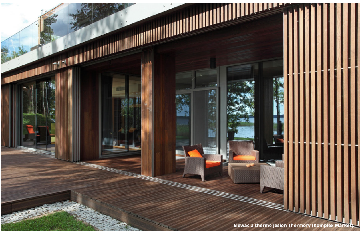
Elewacja thermo jesion Thermory (Komplex Market)

W nowoczesnym budownictwie dylemat: naturalne piękno czy trwałość na lata, właściwie już nie istnieje. Technologia poszła na tyle do przodu, że naturalne drewno stało się jednym z najtrwalszych materiałów, jakich możemy użyć na elewację, łącząc niepowtarzalną estetykę z odpornością, której dawniej poszukiwano w materiałach syntetycznych. Kluczem do sukcesu nie jest jednak tradycyjna tarcica, lecz zaawansowana technologia, która potęguje naturę surowca, wydłużając jego żywotność na więcej niż ćwierćwiecze. Eksperti z Komplex Market wskazują, że dzięki procesom modyfikacji termicznej, drewno staje się materiałem o parametrach technicznych, które wykraczają poza dotychczasowe standardy budowlane.