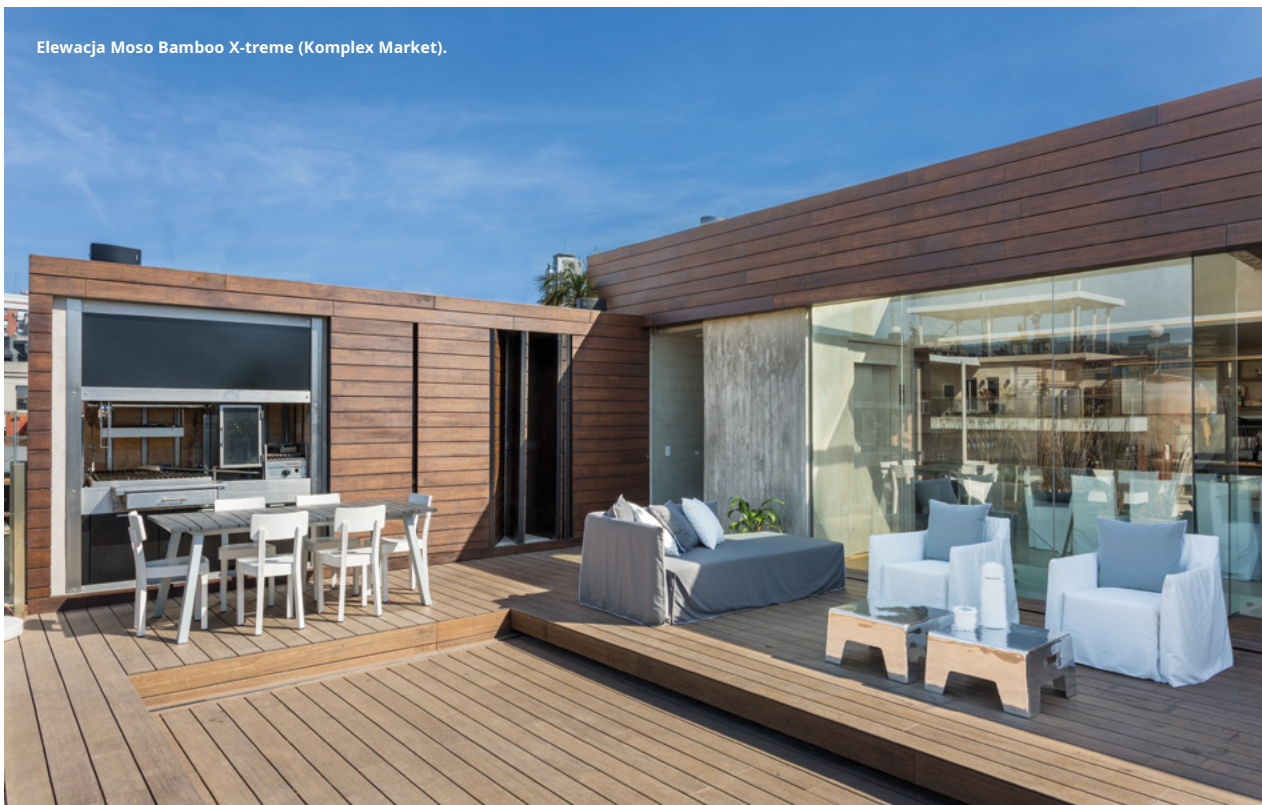
Elewacja Moso Bamboo X-treme (Komplex Market).

propozycja dla tych, którzy szukają twardości niemal kamiennej przy zachowaniu wyglądu drewna. Bambus poddany procesowi